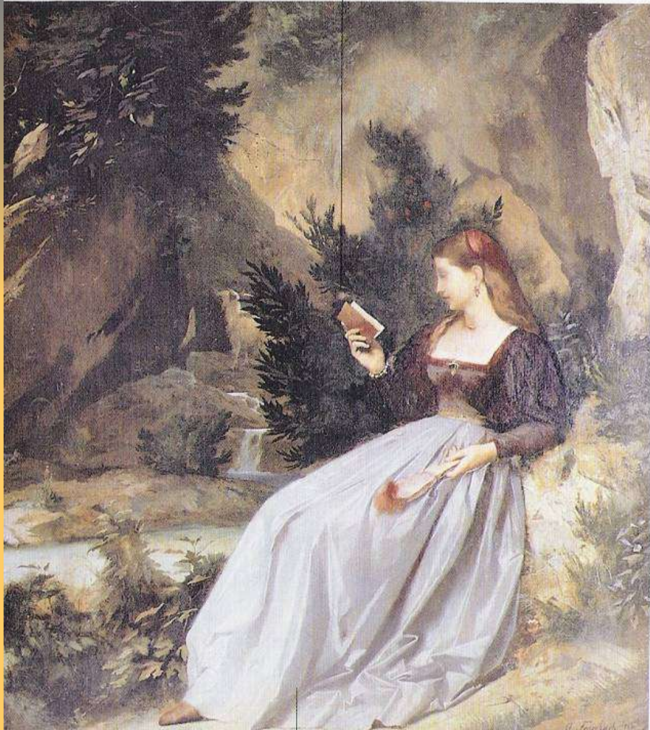
Laura nel parco di Valchiusa (A. Feuerbach, 1864)