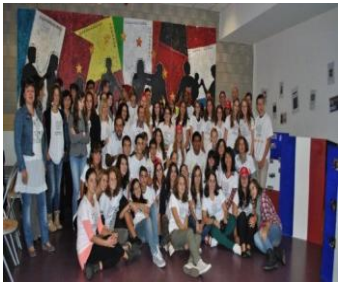
Accueil du président du CESE

Des réalisations, voyages et échanges avec des élèves étrangers qui entrent dans le cadre du projet COMENIUS sur la convivialité.