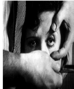
Photo extraite de 'Age d'or' de L. Bunuel

« HISTOIRE DE CREVER L'OEIL POUR MIEUX DONNER À VOIR LE MONDE QUI NOUS ENTOURE »